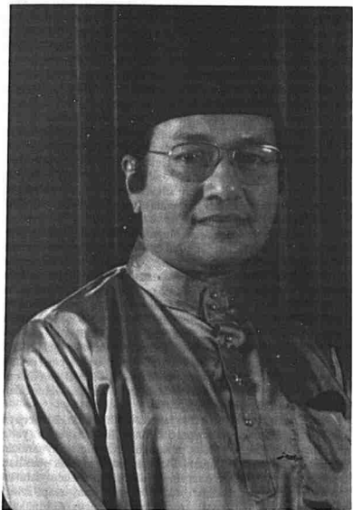
YAB Datuk Seri Dr. Mahathir bin Mohamad