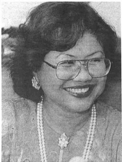
Dato' Sri Rafidah Aziz