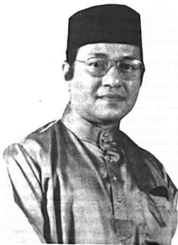
Ucapan Datuk Seri Dr. Mahathir Mohamad merasmikan Perhimpunan Agung Pergerakan Pemuda dan Wanita UMNO Malaysia di Balai Budaya, Dewan Bahasa dan Pustaka, Kuala Lumpur pada 1hb Julai 1976.

Dengan ini, dengan berdoa ke hadrat Allah Subhanahuwata'ala supaya diberi taufik dan hidayah kepada para peserta dan kita semua yang bersidang pada hari ini, saya dengan segala sukacitanya merasmikan Persidangan Agung Tahunan Pergerakan Pemuda dan Pergerakan Wanita UMNO bagi tahun 1976.