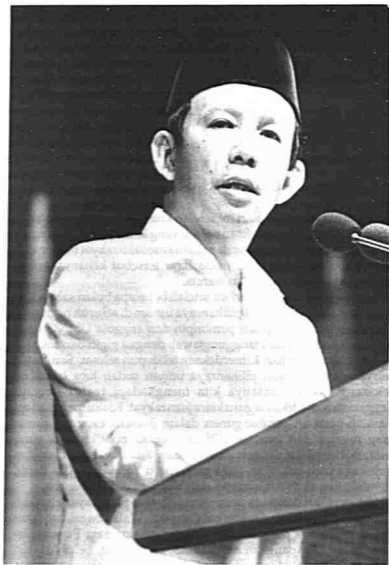
Datuk Musa bin Hitam