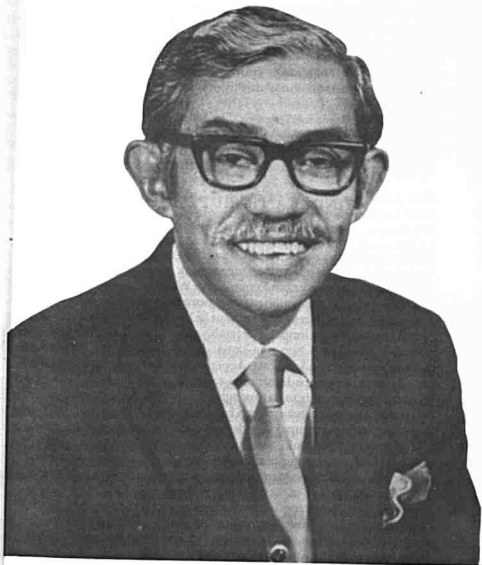
Allahyarham Tun Dr. Ismail bin Datuk Abdul Rahman