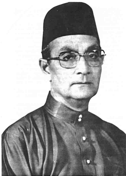
Allahyarham Tun Hussein bin Datuk Onn