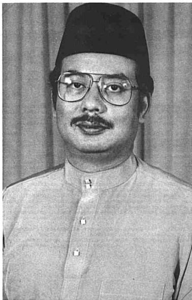
DATO' SRI MOHD. NAJIB TUN HAJI ABDUL RAZAK